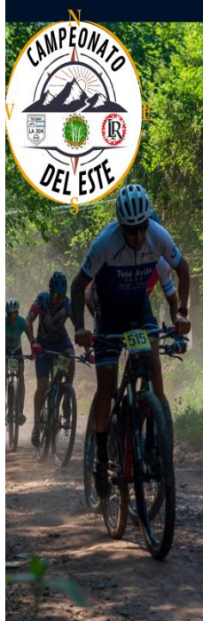
TABLA DE PUNTOS

De esta forma se puntuará a los competidores de cada categoría reconociendo con un 1 punto a los participantes que lleguen a largar la carrera.